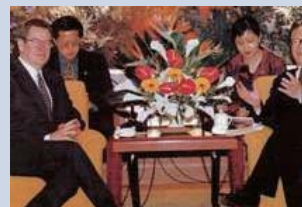
2000: Præsident Jiang Zemin møder statsminister Poul Nyrup Rasmussen