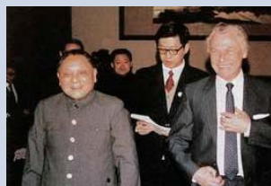
1986: Kinas leder Deng Xiaoping møder statsminister Poul Schlüter