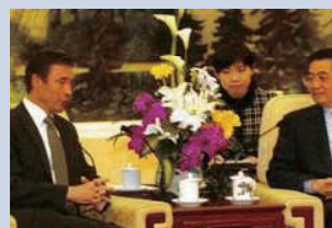
2004: Præsident Hu Jintao møder statsminister Anders Fogh Rasmussen