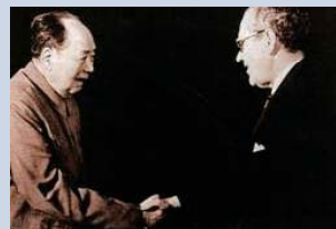
1974: Formand Mao Zedong møder statsminister Poul Hartling