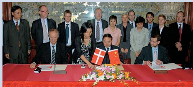
Den kinesiske undervisningsminister Zhou Ji, videnskabsminister Helge Sander og undervisningsminister Bertel Haarder underskriver to omfattende aftaler om uddannelsessamarbejde mellem Danmark og Kina.