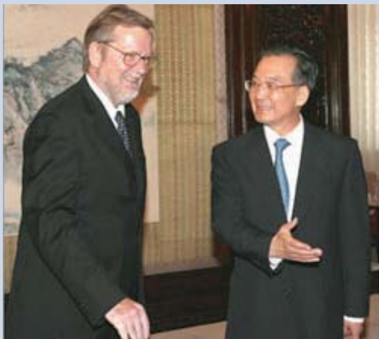
Udenrigsminister Per Sig Møller møder premierminister

Wen Jiabao den 12. maj 2006.